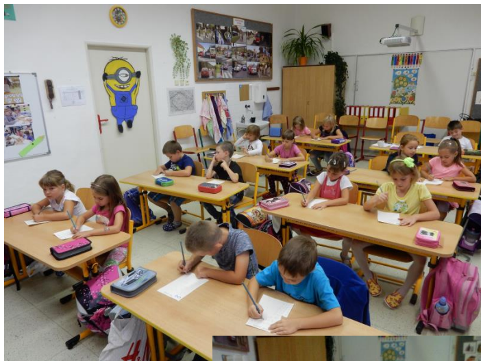
I únava se dostavila